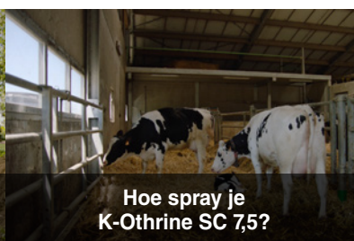
Hoe spray je K-Othrine SC 7,5?