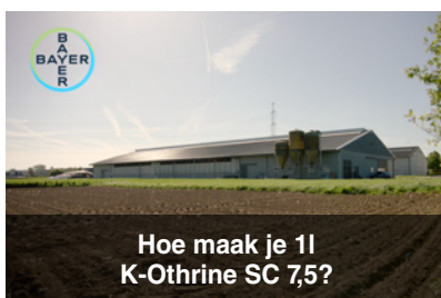
Hoe maak je 1l K-Othrine SC 7,5?

Op de volgende pagina leggen wij stapsgewijs uit hoe u het product kunt gebruiken. Wilt u liever niet lezen? U kunt ook de instructievideo's bekijken. Klik op de beelden.