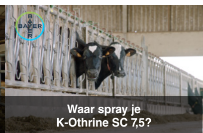
Waar spray je K-Othrine SC 7,5?